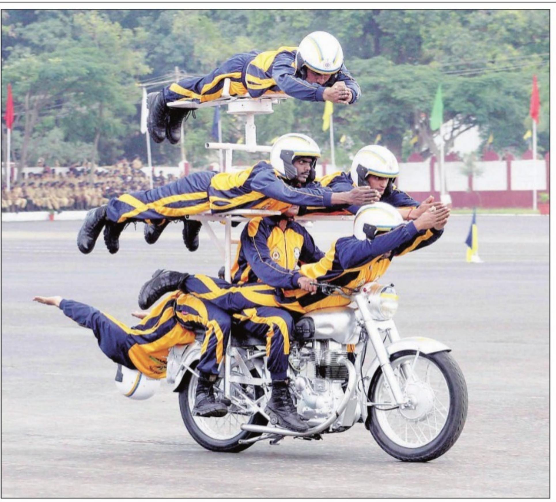
बंगलुरु में मंगलवार को आर्मी सर्विस कोर की 225वीं वर्षगांठ पर मोटरसाइकिल पर करतब दिखाते जवान।